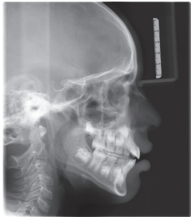
Figura 1. Placa lateral de cráneo con la que se tomó mediciones morfométricas.