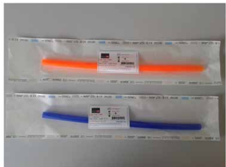
Gráfico 2. Tubo Lax Vox.

Los 35 cm es la distancia promedio entre la boca y el tórax para que los hombros permanezcan relajados, sin embargo, la longitud puede variar dependiendo de la estatura del paciente. El diámetro interno de 9-10 mm es adecuado para que los dientes no se muerdan entre sí. Es importante hacer los ejercicios varias veces al día. Se recomiendan tres a cinco veces durante dos o tres minutos.