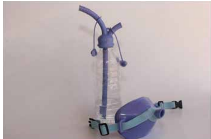
Gráfico 6. POCKET VOX.

Los dispositivos de Pocket Vox y la Mask Vox son herramientas que pueden complementar al dispositivo de Doctor Vox. El Pocket Vox se puede adaptar a una botella y también puede ser combinado con la Mask Vox. La Mask Vox se puede utilizar en conjunto con el dispositivo de Doctor Vox.