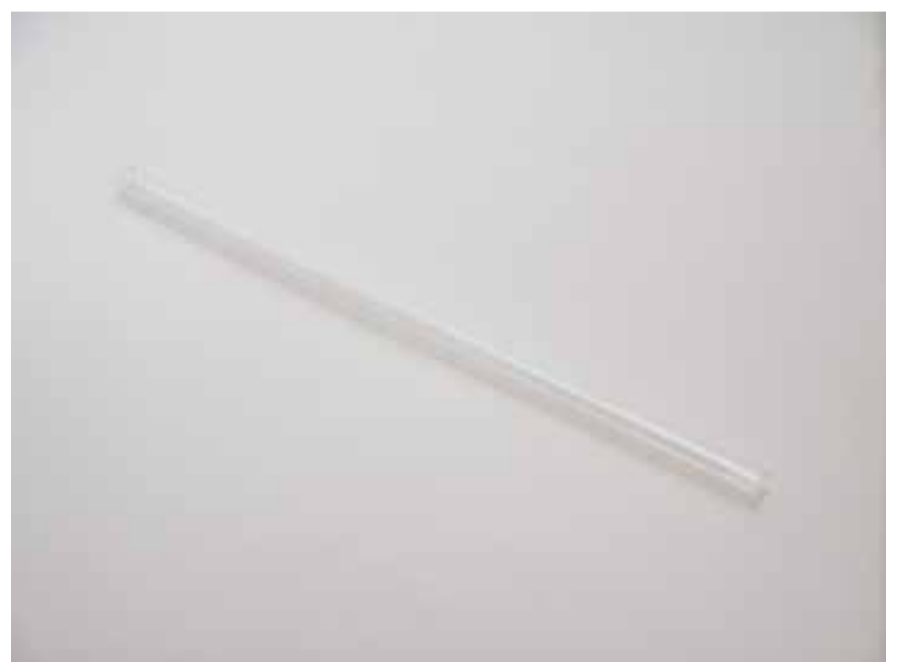
Gráfico 1. Tubo Finlandés.

La longitud del tubo más adecuada para un paciente corresponde con la tesitura vocal como se muestra en la Tabla 1 Recomendaciones de longitudes de tubo de resonancia para fonación en el agua (Wistbacka, 2017).