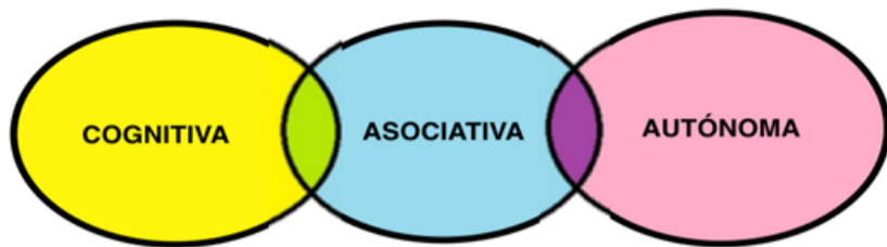
Gráfico 4. Fases de la habilidad motora. Traducida. Imagen facilitada por Ilter Denizoglu.

b. Clínico (plan de acción del médico o terapeuta)