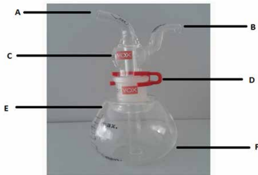
Gráfico 3. DOCTOR VOX. (Denizoglu, 2018) a. Tubo de entrada, b. cuello de cisne (tubo) de salida, c. cámara de relajación, d. clips de bloqueo, e. cubierta de círculo, f. contenedor

Los objetivos directos e indirectos de la terapia de voz de Doctor Vox son los siguientes: