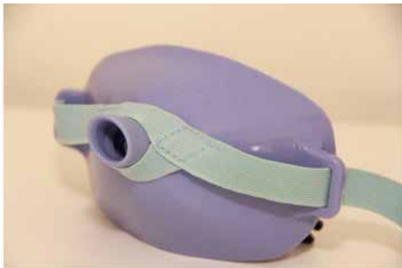
Gráfico 5. MASK VOX.

c. Ejercicios (herramientas y dispositivos)